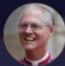
Mass with Archbishop Etienne